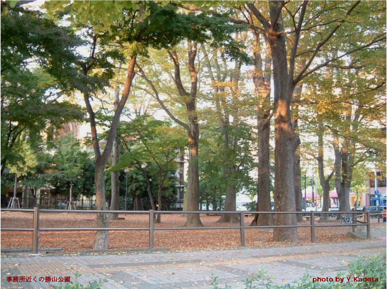
事務所近くの勝山公園