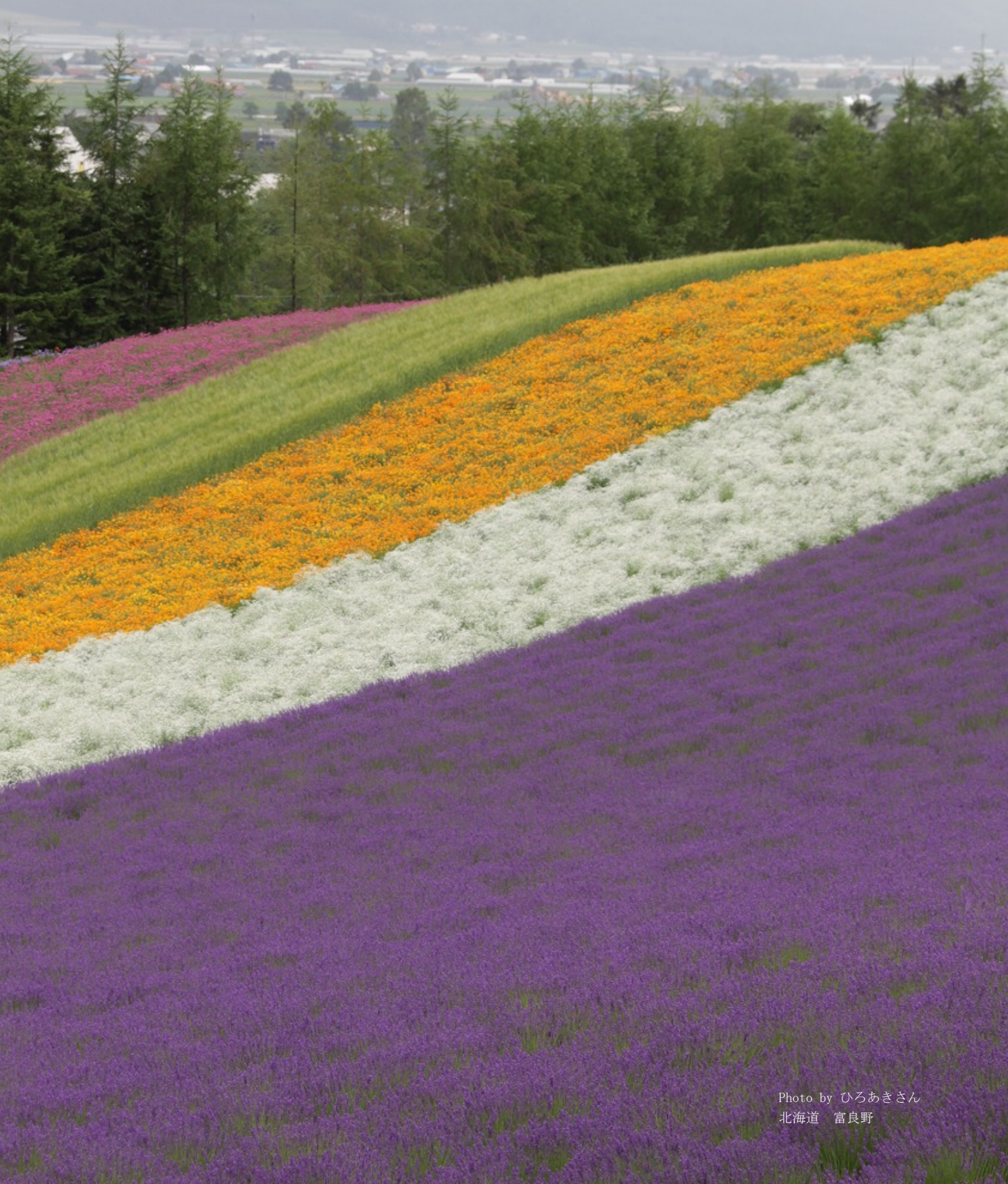
北海道 富良野

URL: http://www.harmony-office.com/ mail: info@harmony-office.com tel:022-796-9231 fax:022-796-9232