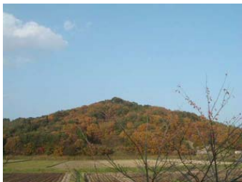
福島県西郷村の燃えるような紅葉...2004.11撮影

今年も残すところあと2ヶ月となりましたね。カレンダーも手帳も残りが薄くなって、そろそろ来年のものを用意しなければ、と思っています。